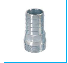
HORTUM REKORU GALVANİZ