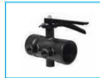
KELEBEK VANA PLASTİK GÜBRELEME ÇIKIŞLI