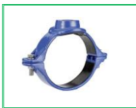
SÜPER KOLYE (SFERO)