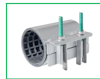
KOLAY TAMİR KELEPÇESİ TEK TARAFLI