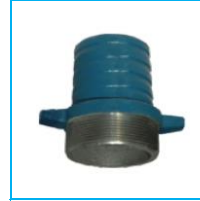
HORTUM REKORU DÖKÜM