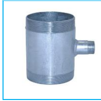
DAMLAMA ADAPTÖRÜ GALVANİZ TE