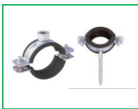
SOMUNLU KELEPÇE TRİFONLU KELEPÇE