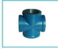
İSTAVROZ TE DÖKÜM