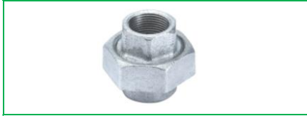
KONİK REKOR GALVANİZ