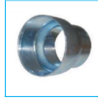
MANŞON REDÜKSİYON DEMİR