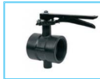
KELEBEK VANA PLASTİK İÇ DİŞ