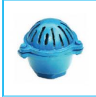
TABAN SÜZGEÇ DÖKÜM