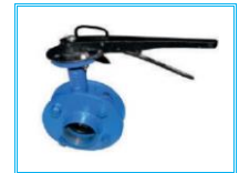
KELEBEK VANA TAKIM