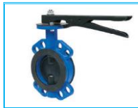
KELEBEK VANA AĞIR TİP