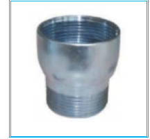
NİPELLİ MANŞON REDÜKSİYON DEMİR