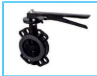
KELEBEK VANA PLASTİK