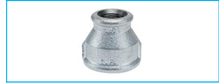
MANŞON REDÜKSİYON GALVANİZ

Galvaniz grubunda 2" ve üzeri çaplar için lütfen fiyat ve stok sorunuz.