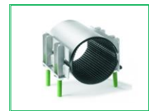
KOLAY TAMİR KELEPÇESİ ÇİFT TARAFLI PARÇA