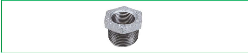
NİPEL REDÜKSİYON GALVANİZ