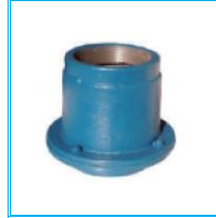
ARA KLAPE DÖKÜM