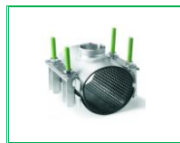
KOLAY TAMİR KELEPÇESİ MANŞONLU