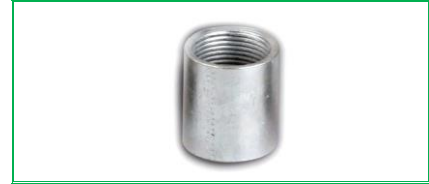
MANŞON GALVANİZ KALIN