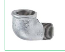
KUYRUKLU DİRSEK GALVANİZ