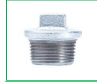
KÖR TAPA GALVANİZ